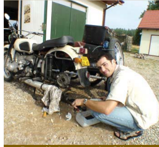
nt-Pérollais vers la Sibérie