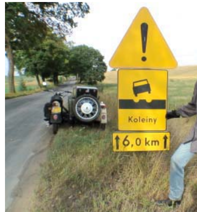
Le charme des routes de l'Est.

Après 1 500 kilomètres, la moto commence à donner ses premiers signes de fatigue. Une visite au garage s'impose : ce sera à l'Old Timer Garage, le temple des vieux side-cars russes et allemands, pour un changement de roue et de pneus, avant de repartir vers Saint-Petersbourg. Chaque étape du voyage apporte son lot de rencontres avec des habitants, à la fois surpris et curieux de l'aventure de ces deux Français sur leur drôle de monture. En Pologne, nombreuses ont été les familles à ouvrir leurs portes et leur frigo. En Lituanie, c'est une famille de fermiers qui leur a offert l'hospitalité deux jours durant.