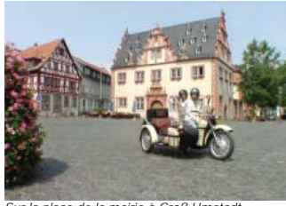
Sur la place de la mairie à Groß-Umstadt.