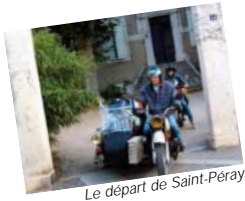
Le départ de Saint-Péray.