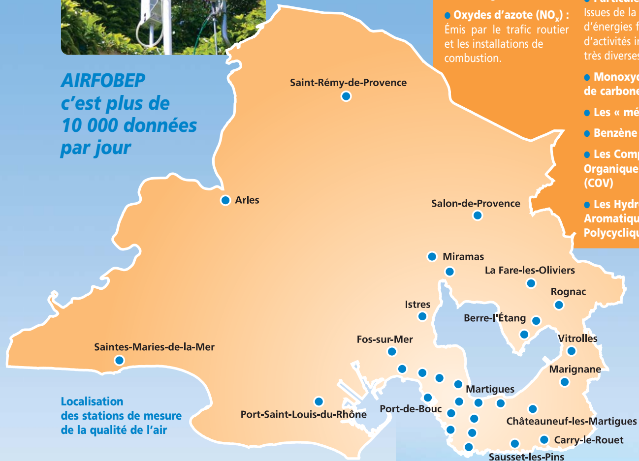
Localisation des stations de mesure de la qualité de l'air

AIRFOBEP c'est plus de 10 000 données par jour