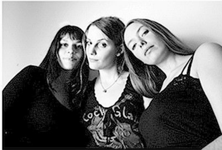
Tentation-descendre pour comprendre