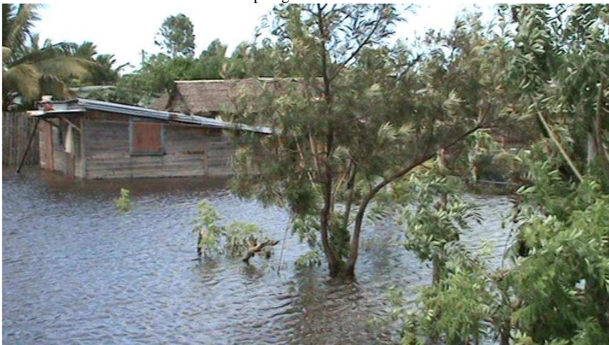
Après le passage de la dernière dépression tropicale (Jade)