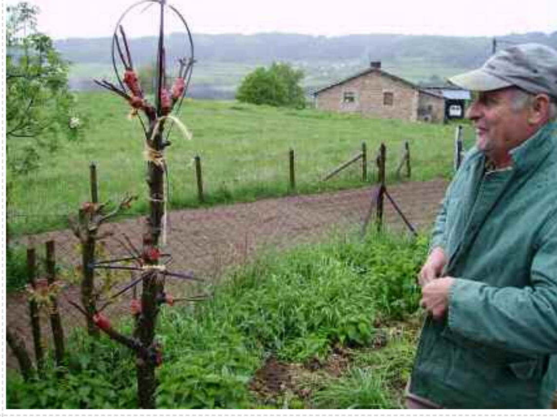
Les créations chimériques de M. Cussonnet à Rochette-Ribier et à Viverols : des greffes multiples pour un seul arbre.

La conservation des variétés intéressantes, même non identifiées, et particulièrement celles portées par les vieux arbres, constitue la première urgence de sauvegarde de ce patrimoine fruitier encore largement inexploré. Cultiver une de ces variétés chez soi est un acte citoyen dont vous profiterez, et dont profitera la postérité. Si une variété non connue vous intéresse, et que vous ne savez pas greffer, vous trouverez sûrement un greffeur bénévole dans le voisinage : le verger conservatoire de Tours-sur-Meymont peut parfois fournir des porte-greffe. On peut aussi demander à un pépiniériste de préparer un arbre à la demande. Les jardins Révol, à la Chaise-Dieu sont notamment capables de vous proposer un « contrat de mise en culture » d'une variété dont vous fournirez le greffon.