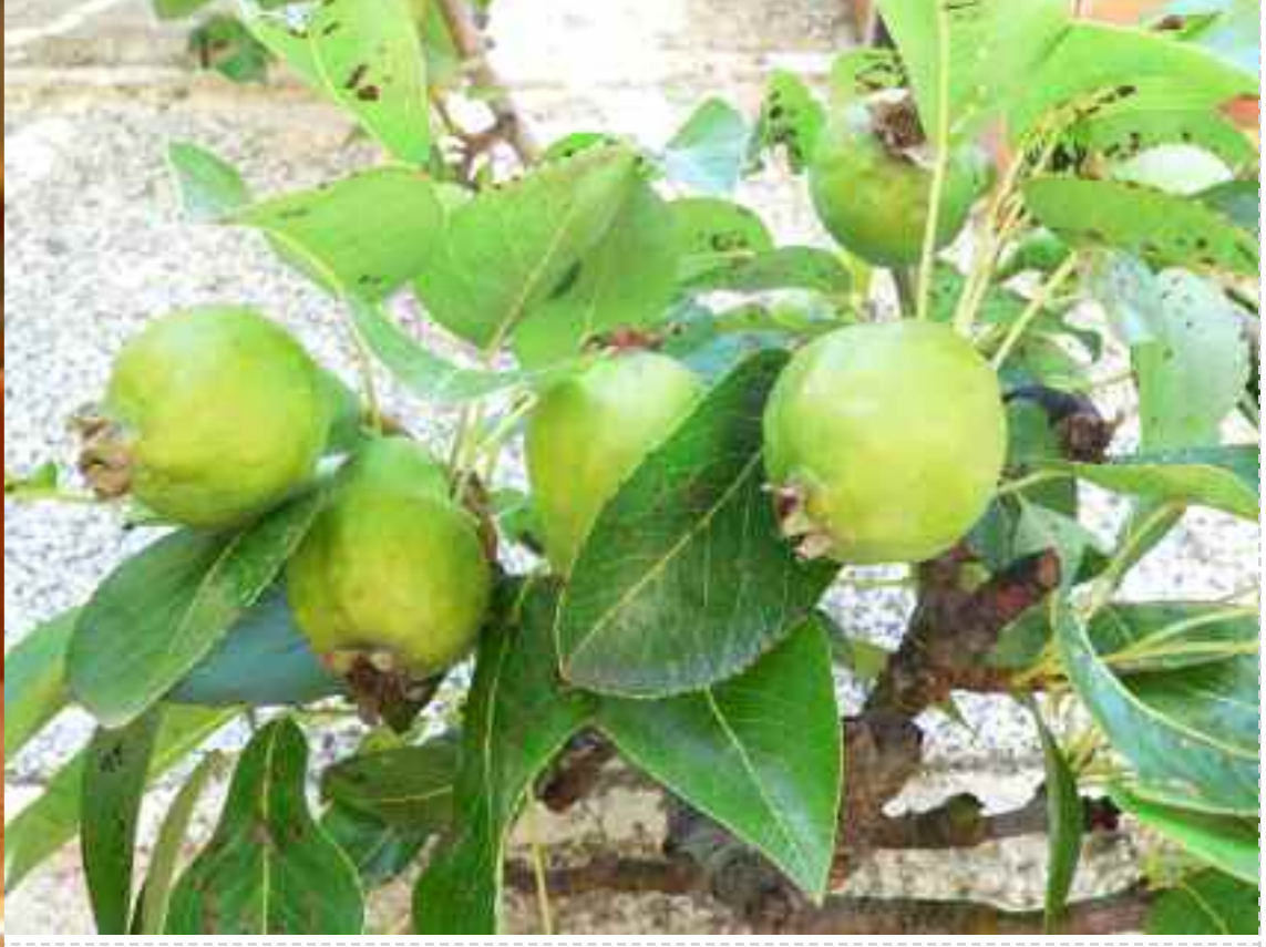
Autre variété inconnue : poires bosselées, en forme de coing.