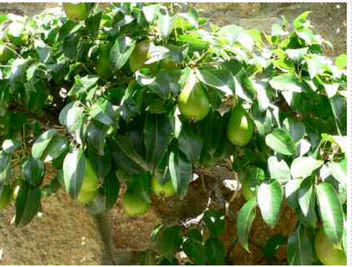
La Louise-Bonne : une variété excellente portée par des arbres à la vigueur exceptionnelle.

Cette poirière a été greffée sur poirier franc : le porte-greffe utilisé par les pépiniéristes pour les arbres de haute-tige.