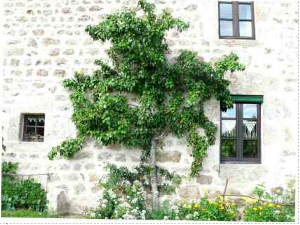
À l'auberge du Droublieù, on a remplacé une mauvaise variété par deux bonnes. L'arbre a été greffé il y a vingt-cinq ans.

La greffe autorise quelques fantaisies et on peut faire croître différentes variétés sur un même arbre. Par la technique de la greffe en couronne, on peut aussi remplacer une variété peu intéressante par une ou plusieurs autres plus goûteuses, cette greffe peut être pratiquée sur des arbres déjà gros.