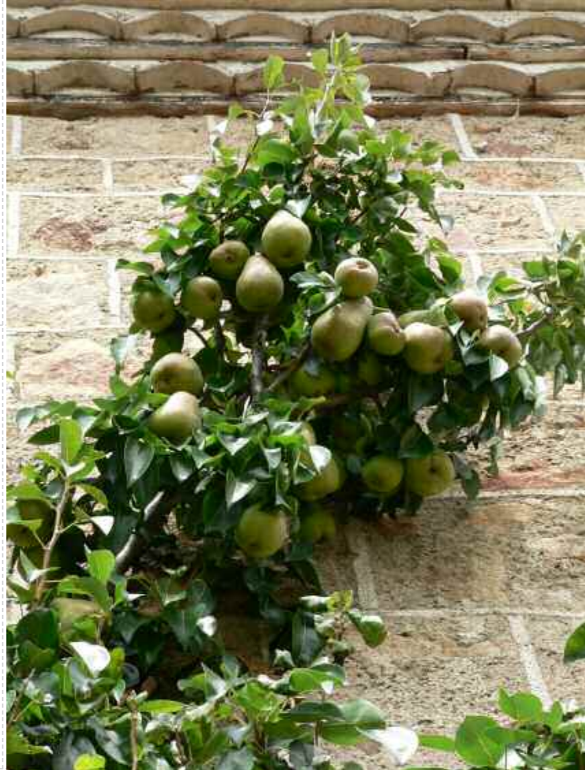
À Rochette-Ribier, une poirière de 70 ans donne des poires à couteau d'une livre et plus ! La variété est inconnue des propriétaires.

Les variétés sont bien sûr innombrables, de qualité variable au regard des exigences actuelles. Si certaines donnent des fruits « durs, qui ne mûrissent pas », les poirières portent le plus souvent des fruits à couteau, juteux et sucrés. Louise-Bonne, Williams, se retrouvent souvent. Mais les variétés sont souvent inconnues des propriétaires, comme celle qu'on retrouve à la Valette et à Rochette-Ribier : ses poires sucrées pèsent couramment une livre, le record est détenu par une poire de 900 grammes. Même si la variété est inconnue, les propriétaires savent parfois où a été pris le greffon.