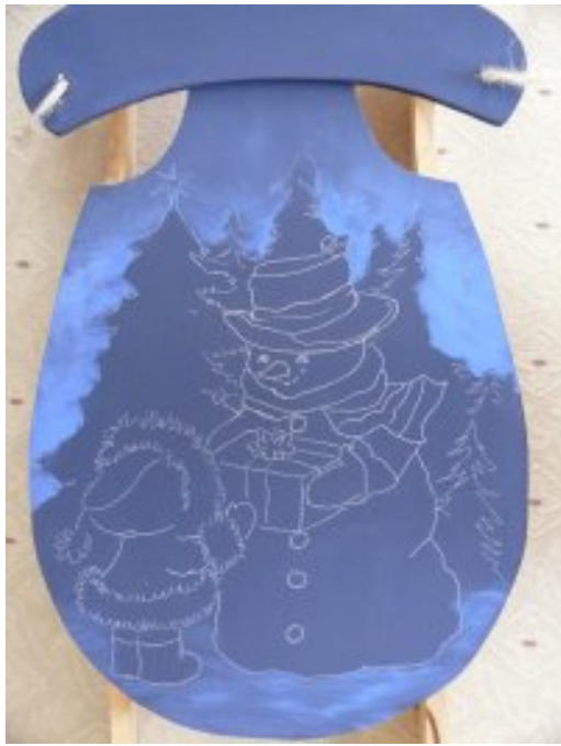
Dégradé du ciel en Saphir