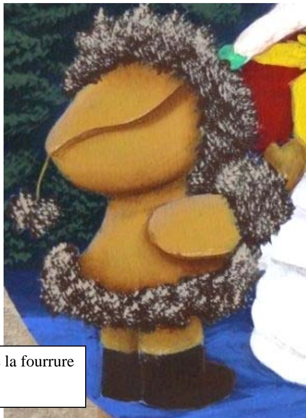
Première étape de la fourrure au pied de biche