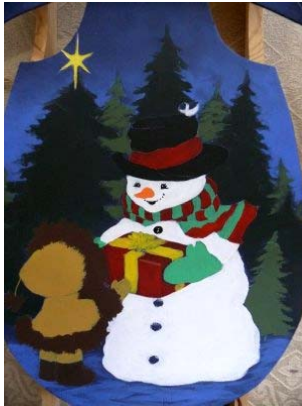
Couches de base