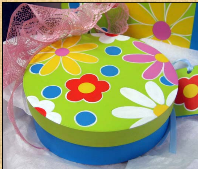
Réalisation et enseignement : Lise Mongeau

Peint sur une boîte cadeau 7 x 2 po. et un porte-clés en bois