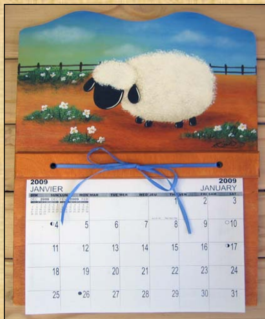
Réalisation et enseignement : Lise Mongeau